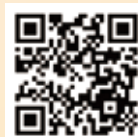
幼兒專責醫師 診所查詢

您可以到「衛生福利部幼兒專責醫師個案管理資訊系統」網站「首頁>>家長專區>>參加院所查詢」查詢加入本計畫之醫療院所